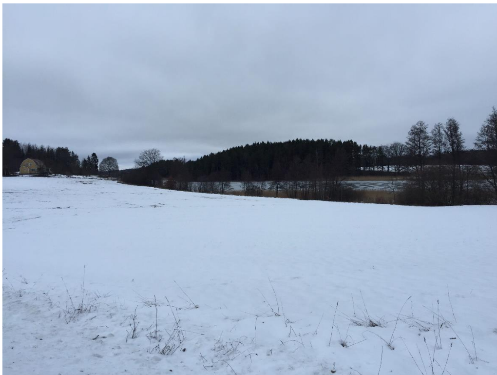
Figur 1, åkermarken i LIS-områdets södra del.