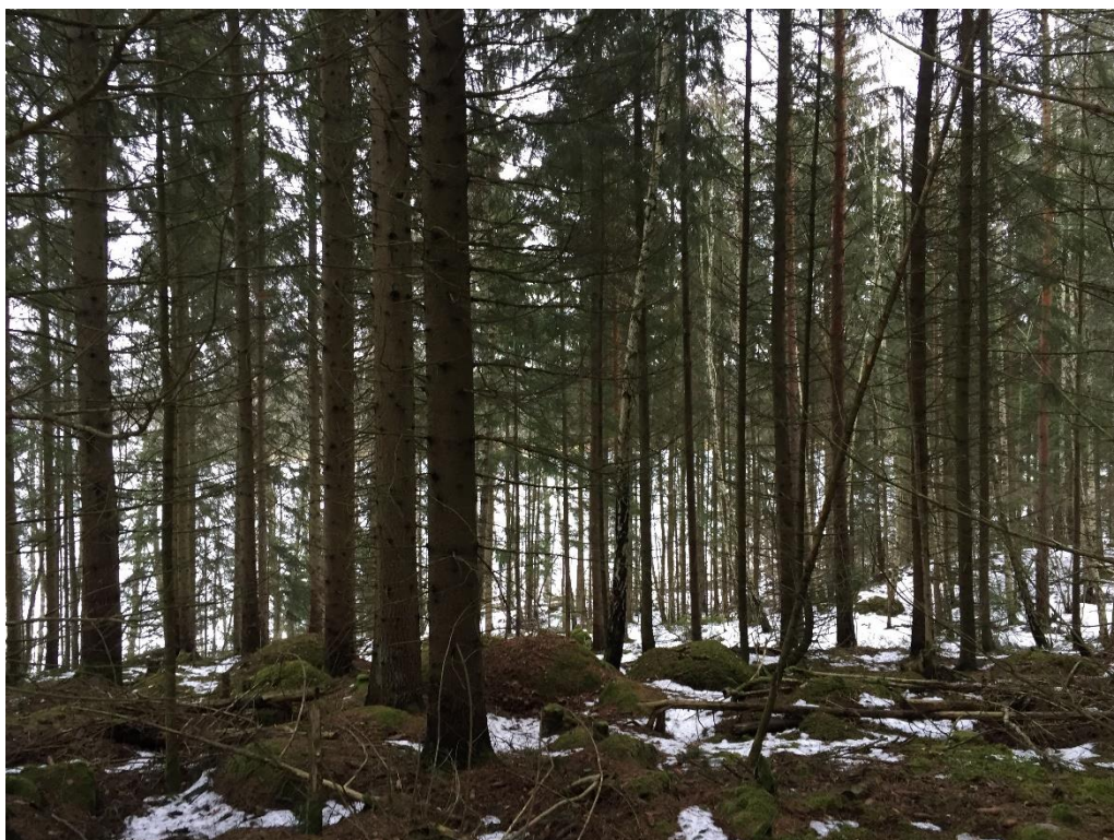
Figur 4, skogsområdet direkt norr om Vrena prästgård.