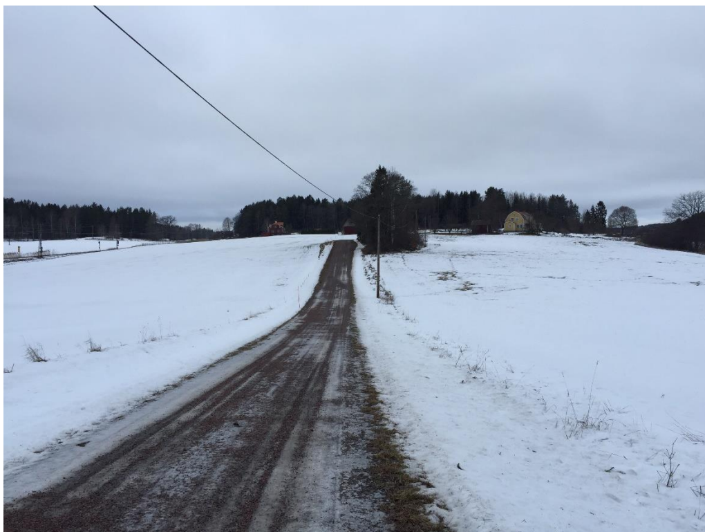
Figur 2, en väg löper genom hela LIS-området.