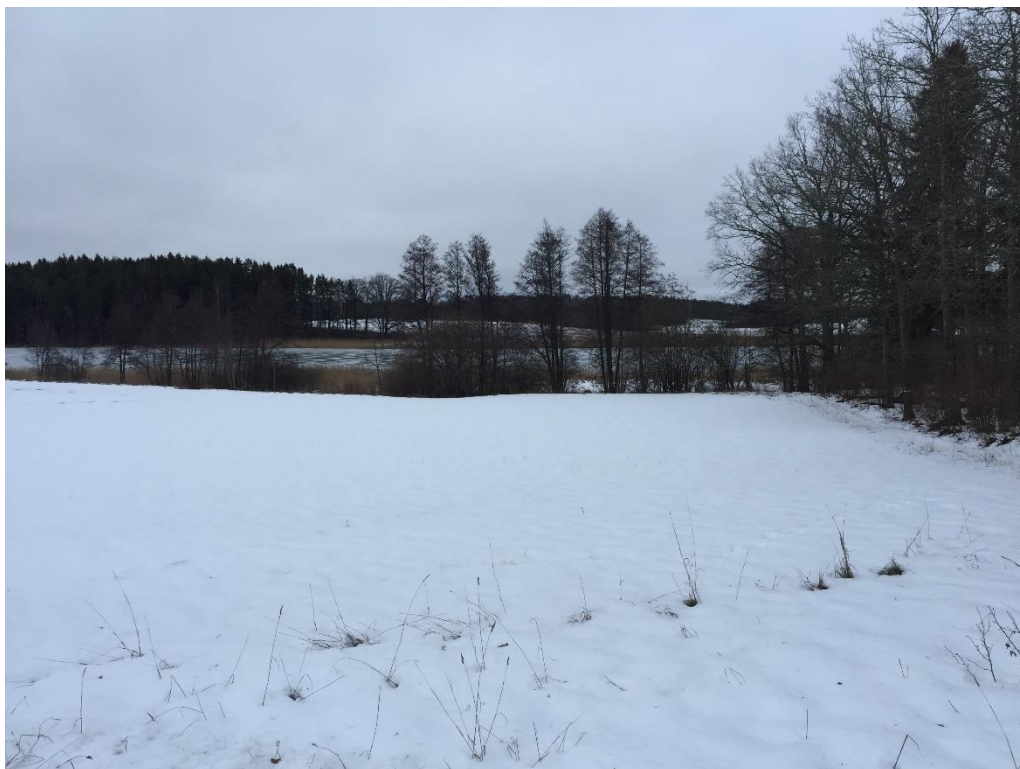
Figur 3, södra gränsen mot Naturvårdsavtalet.