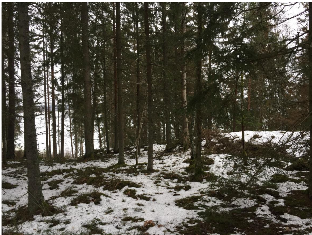
Figur 6, nordligaste delen av LIS-området.