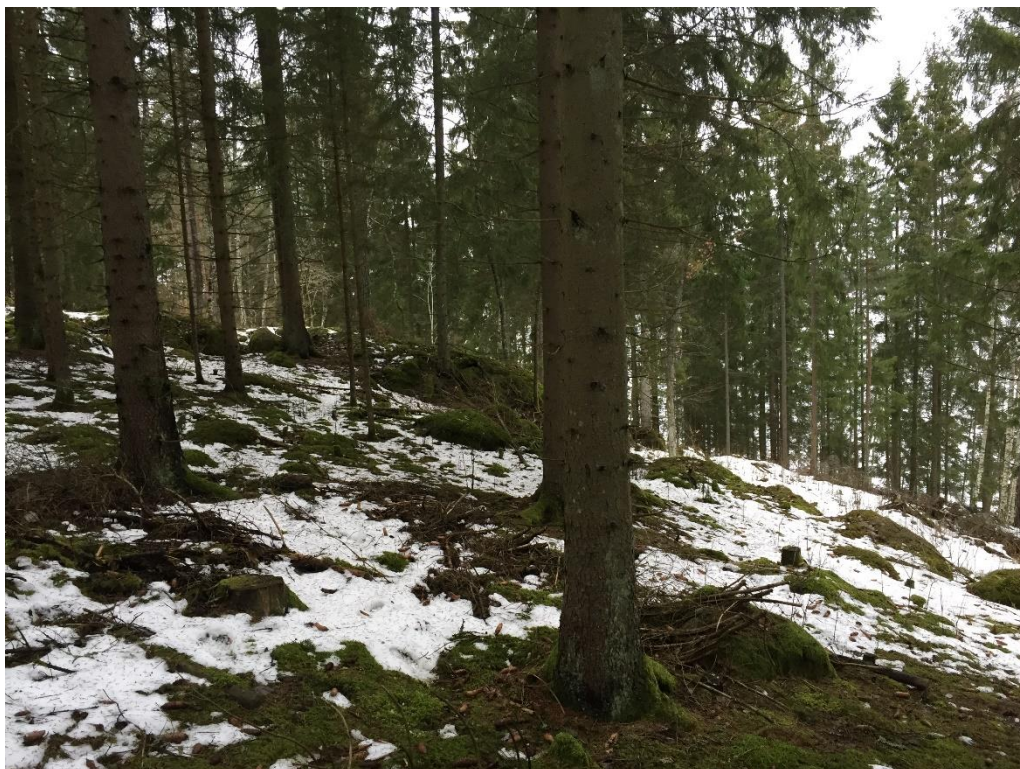
Figur 5, terrängen är brantare i områdets norra del